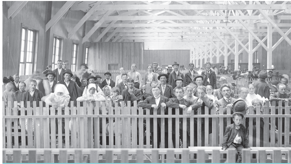
လိုးကတ်ပိုင်ကို "Baltimore's Ellis ကျွန်း" ဟုခေါ်တွင်ပြီး နယူးယောက်မြို့နှင့် ဖီလယ်ဒီးဖီးယားမြို့ပြီးနောက် အမေရိကန်ပြည်ထောင်စုသို့ ရွှေ့ပြောင်းနေထိုင်လာသူများအတွက် ၎င်းမြို့ငယ်သည် တတိယအကြီးဆုံး အဓိကဝင်ပေါက်နေရာတစ်ခု ဖြစ်ပါသည်။

MORA သည် ဒုက္ခသည် 40,000 ကျော်အား မေရီလန်ပြည်နယ်ကို ၎င်းတို့၏ နေအိမ်ဖြစ်လာစေရန်၊ “အိုးအိမ်စွန့်ခွာထွက်ပြေးရသူများ” အဖြစ်မှ မိမိဘာသာရပ်တည်နိုင်ပြီး နိုင်ငံစီးပွားရေးနှင့် ဒေသလူ့အသိုင်းအဝိုင်းများတွင် ကူညီပံ့ပိုးပေးသော အဖွဲ့ဝင်များအဖြစ် ကူးပြောင်းနိုင်အောင် ကူညီပေးခဲ့ပါသည်။ တတ်နိုင်သမျှအမြန်ဆုံး ကိုယ်အားကိုးကိုင်သူများ ဖြစ်လာစေရန်အတွက် ဒုက္ခသည်များအား ကူညီရန်ရည်ရွယ်သည့် အသွင်ကူးပြောင်းရေးဝန်ဆောင်မှုများကို အစီအစဉ်ရေးဆွဲခြင်း၊ စီမံခန့်ခွဲခြင်းနှင့် ညှိနှိုင်းဆောင်ရွက်ခြင်းတို့ကို အများပြည်သူနှင့်ပုဂ္ဂလိက ဝန်ဆောင်မှုပေးသူများ ကွန်ရက်တစ်ခုခုတစ်ခုခု ကျွန်ုပ်တို့ လုပ်ဆောင်ပါသည်။ ဒုက္ခသည်များကို အကူအညီပေးရန်အတွက် အဓိကနယ်ပယ်များ အမေရိကန်လူမှုဘဝနှင့် နေသားကျအောင် လုပ်ဆောင်ရာတွင် ငွေကြေး အကူအညီ၊ အလုပ်အကိုင် နေရာချထားမှု၊ ရပ်ရွာနှင့် အသားကျအောင်ပြုလုပ်ခြင်း၊ အင်္ဂလိပ်ဘာသာစကားနှင့် အသက်မွေးဝမ်းကျောင်း သင်တန်းများ၊ လူငယ်များအတွက် ပညာရေးဆိုင်ရာပံ့ပိုးမှု၊ ကျန်းမာရေးကိစ္စ စီမံခန့်ခွဲမှုနှင့် အခြားပံ့ပိုးပေးသည့် ဝန်ဆောင်မှုများ ပါဝင်ပါသည်။